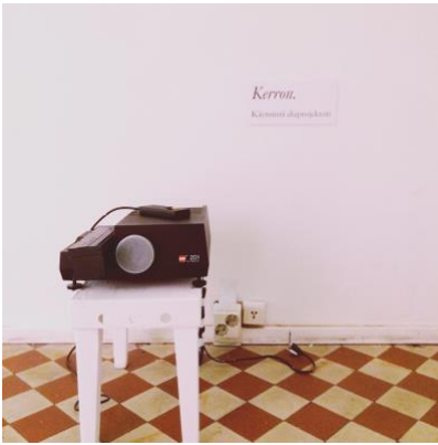
Kerron. Diakuvien sarja.

TRE : DÉRIVE : HKI 24.-25.3.2011. Kirjallinen ääniteos, Tampere Sosiologiapäivät. Työryhmä: Ina Aaltojärvi, Pia Houni, Aino Järvi-Eskola.