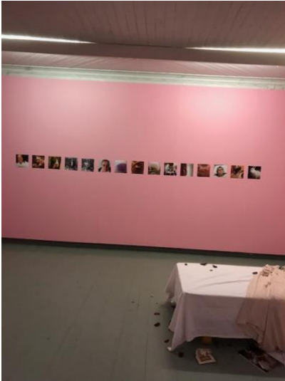
Näyttelyhuone, valokuvasarja ja osa vuoteesta.