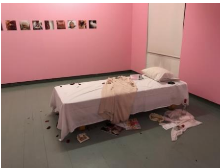
Näyttelyhuone, valokuvasarja ja vuode.

RYTMIitaju 2017 käsikirjoitus ja kuratointi yhdessä kuvataiteilija Krister Ghåhnnin kanssa. Hyvinkään taidemuseo ja Promenadigalleria. Avajaiset 15.6. Näyttely 16.6.2017- 3.9.2017. https://www.hyvinkaa.fi/hyvinkaan-taidemuseo/nyt/rytmitaju-2017/