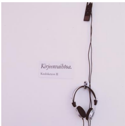
Kirjeenvaihtoa II . Kuuloketeos.