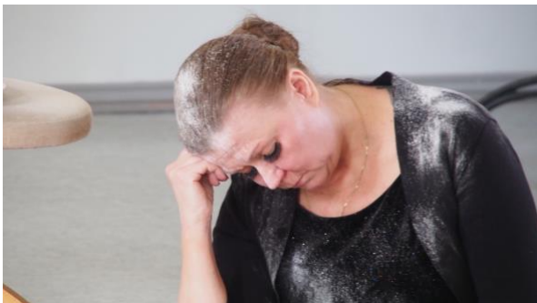
Pölyn alla lukeva nainen.