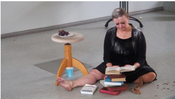
Pölyn alla lukeva nainen.

5.5.2019 Pölyn alla lukeva nainen . Esityksellinen performanssi Taina Riikosen puheenvuorossa ”Artist education at the era of corporate university: sweat he sweat and focus on enterpreneur identity? 9th Nordic Philosophical Practice Conference. Lapinlahti, Helsinki.