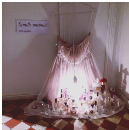
Näyttelyn kollaasiteos Sinulle unelmia .

Tässä gallerianäyttelyssä lähtökohtana oli oman elämänsä historiaa materiaalit, erityisesti kokemukset, joita ei arjessa jaeta. Näyttelymateriaali koostui valokuvista (seinillä ja diaheijasteina), vuoden mittaisesti toteutetusta selfiekuvasarjasta. Kahdesta erillisestä kuuloketeksteistä, joissa tekijät lukivat omia päiväkirja- ja kirjekatkelmiaan nauhalla ja taustalla oli äänisuunnittelu.