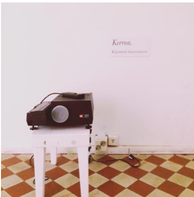
Kerron. Diakuvien sarja.

TRE : DÉRIVE : HKI 24.-25.3.2011. Kirjallinen ääniteos, Tampere Sosiologiapäivät. Työryhmä: Ina Aaltojärvi, Pia Houni, Aino Järvi-Eskola.