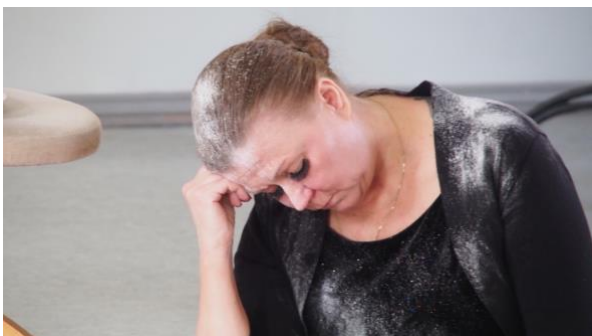
Pölyn alla lukeva nainen.