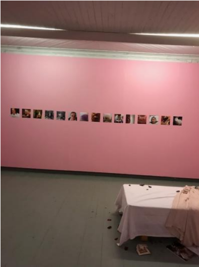
Näyttelyhuone, valokuvasarja ja osa vuoteesta.