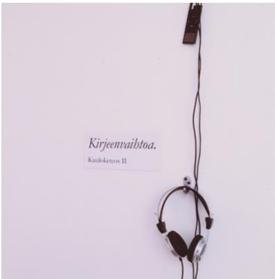
Kirjeenvaihtoa II. Kuuloketeos.