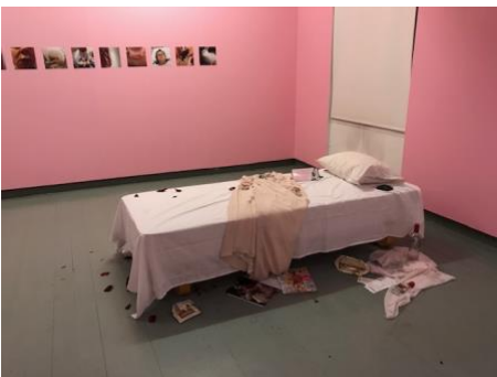
Näyttelyhuone, valokuvasarja ja vuode.