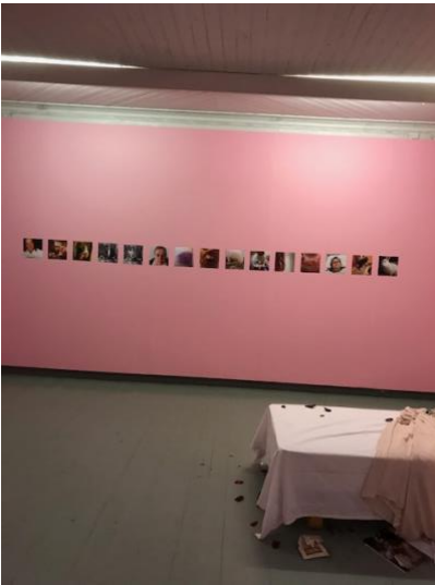
Näyttelyhuone, valokuvasarja ja osa vuoteesta.