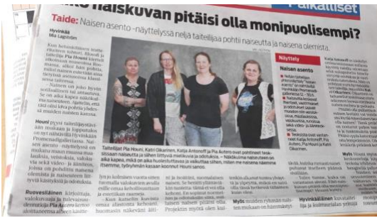
Hyvinkään paikallislehden haastattelu työryhmästä.

Ryhmänäyttely. Hyvinkään taiteilijaseuran joulunäyttely 15.12.-31.12.2019 Promenadigalleri.