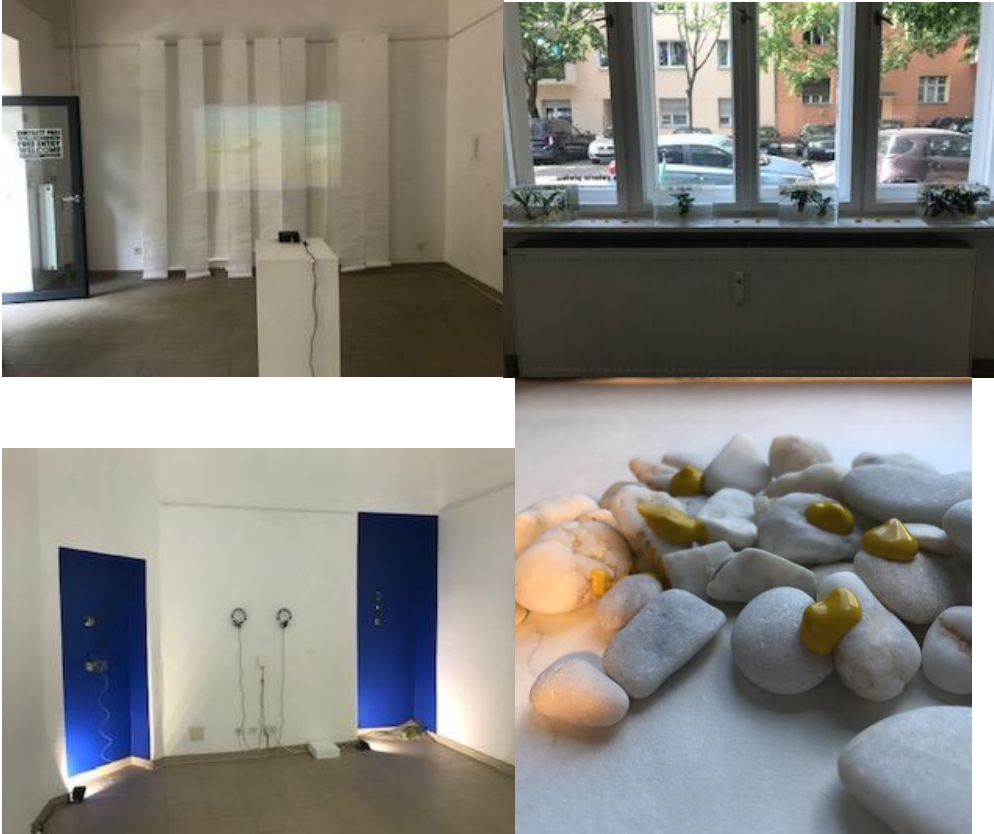
Holy Traveler näyttelyn kuvia: videoteos japanin paperille, vesikasvien asetelma ikkunalla, siniset syvennykset & vesikasvit & hiekka ja kuuloketeos, näyttelyjulisteen kuva.

Ryhmänäyttely Naisen asento . Näyttely 12.-30.6.2020 Promenadigalleria, Hyvinkää.