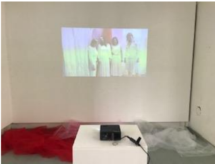
Kuva videoteoksesta ja asetelmasta. Videoheijastus seinään ja tilaan suunnitellut sifonkikankaat.