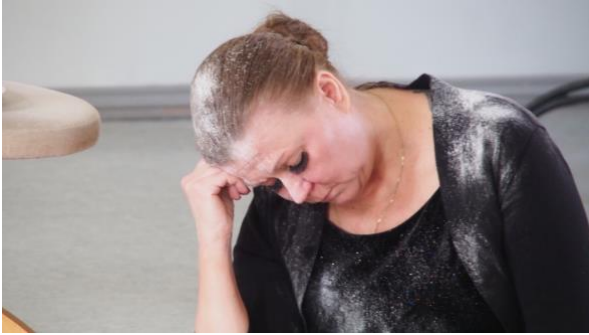
Pölyn alla lukeva nainen.